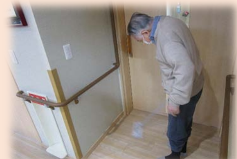
なして毎日ほこり出るべ