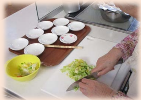
もうちょっと小さく切るか?

やばせ翔裕館では18名のご利用者がそれぞれ役割をもって、日々生活を送っています。食事の準備・片づけ、共有部の清掃、洗濯干しや洗濯タタミ等々!!今まで家事を行ってきた人!(^^)! 行ってこなかった人(^_^) に関係なく、皆さま手際よく役割をこなしてくださっています。