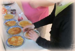
ちょっとこれ多い?